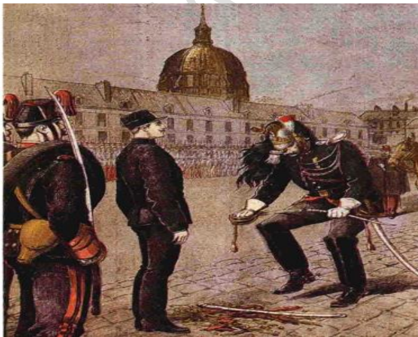
Figure 10: La dégradation militaire du "traître" Alfred Dreyfus. Le Petit Journal, 1895.