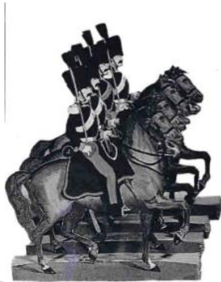
Figure 4 : Cavaliers du Premier Empire