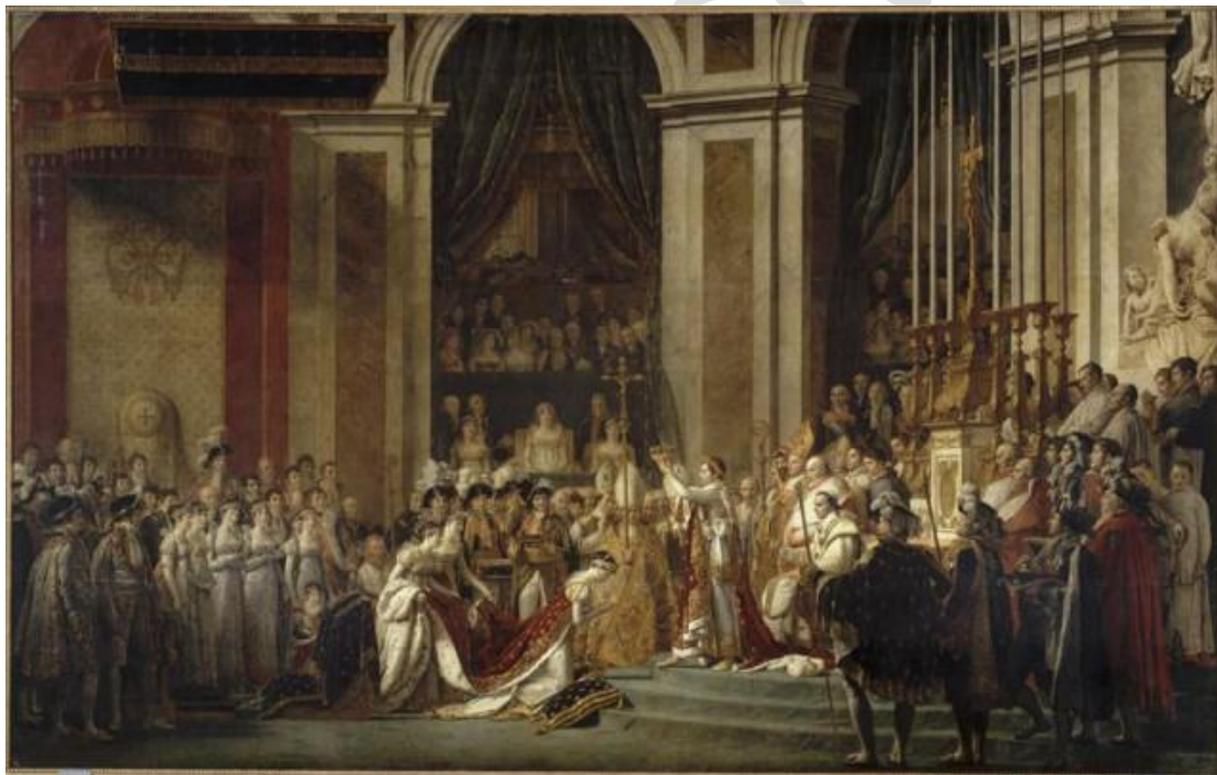
Figure 2: Sacre de l'Empereur Napoléon.

Durant cette même année, il fonde le Premier Empire et se fait nommer Empereur des Français , puis sacrer 1 par le pape sous le nom de Napoléon I er .