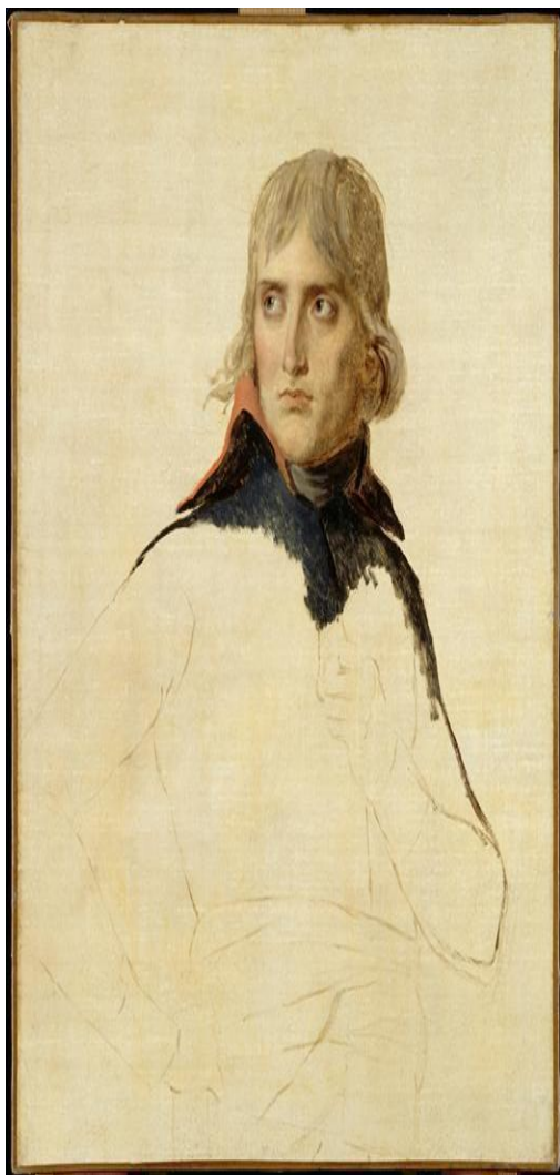
Figure 1: Le général Bonaparte, par Jacques-Louis

Le coup d'Etat de Napoléon inaugure un long cycle de transformations politiques et sociales qui se poursuivent au XIX e siècle à travers différentes expériences : monarchie constitutionnelle, empire, république et restauration. Les débats sur la souveraineté, la représentation politique, les libertés publiques et la place de la religion dans la société structurent durablement la vie politique française. De nombreuses institutions et valeurs qui s'imposeront progressivement trouvent leur origine dans cette période fondatrice.