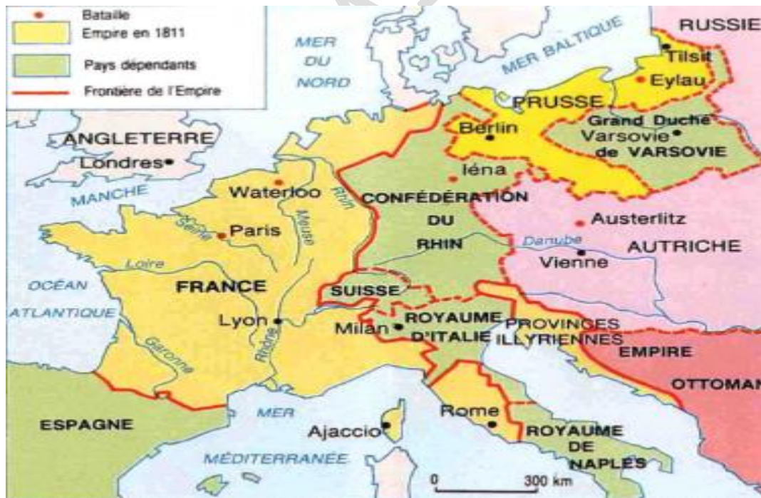
Figure 5: L'Empire de Napoléon

A partir de 1814, les échecs vont se succéder : la capitale Paris, étant occupée par les armées ennemies (Angleterre, Autriche, Prusse et Russie), doit capituler, obligeant Napoléon à céder et installer au pouvoir une monarchie