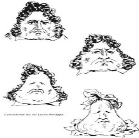
Figure 7: caricatures du roi Louis-Philippe

Le roi Louis-Philippe gouverne dans le cadre d'un régime parlementaire. Le droit de vote est toujours réservé à la bourgeoisie, la majorité des français ne vote toujours pas. Tandis que la France commence à constituer son empire colonial avec l'Algérie, la révolution industrielle entraîne la naissance d'un prolétariat misérable.