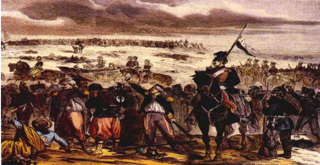
Figure 8: Napoléon III quitte le champ de bataille après la défaite de Sedan

Le 4 septembre 1870 , la déchéance de l'Empereur est proclamée. La France entre définitivement en république. Napoléon III se fait d'abord prisonnier, puis exilé en Angleterre où il meurt trois ans plus tard.