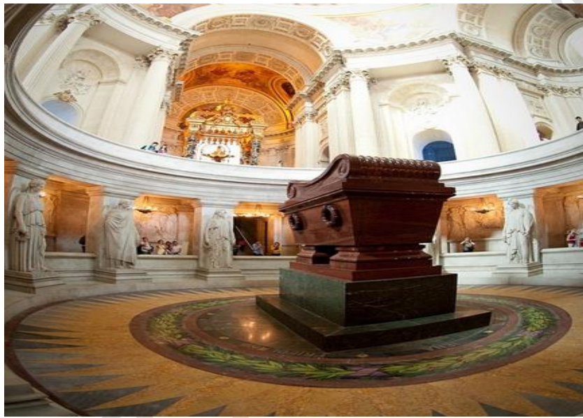
Figure 6: Tombeau de Napoléon Ier aux Invalides, Paris.

Cependant, Napoléon décide de rentrer en France, il marche sur Paris où il fait une entrée triomphale et reprend le pouvoir pendant les Cent jours (du 20 mars au 20 juin 1815). Mais l'Europe s'unit contre lui, et c'est la défaite de Waterloo : Napoléon doit céder pour la seconde fois. Il est exilé à Saint-Hélène où il meurt cinq ans après. Ses cendres sont transférées plus tard aux Invalides.