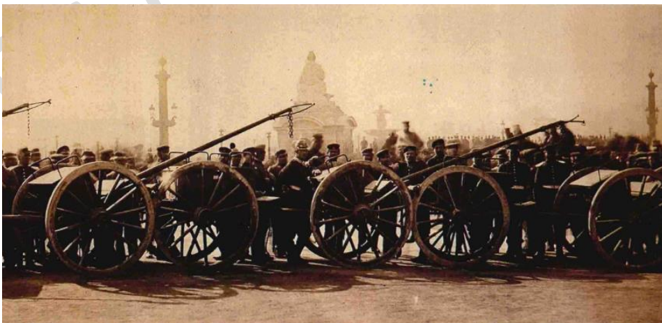
Figure 9: L'arrivée des prussiens à Paris en 1871

A partir de 1870, La France va proclamer l'avènement de la III e République, la plus longue des Républiques, qui durera de 1870 jusqu'à 1940. Mais elle sera traversée par bien de crises politiques. Les Prussiens, après le désastre de Sedan, envahissent le pays. Ils assiègent la ville de Paris. Le peuple parisien refuse de capituler, les soldats refusent de livrer leurs canons et la guerre civile déclenche.