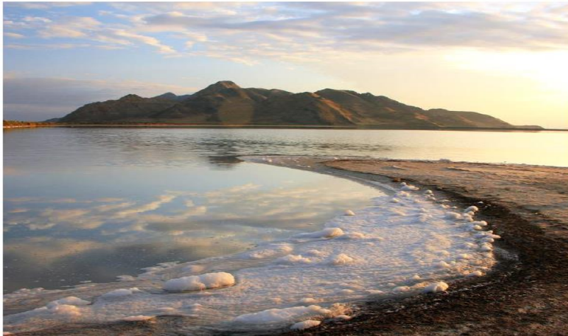
Figure 1 : Le Great Salt Lake, dans l'Utah, aux États-Unis (dépôts de sel).

Les halophiles sont des micro-organismes qui ne peuvent croître qu'en présence de sel généralement sous forme de chlorure de sodium (NaCl). Les halophiles sont classées en trois catégories : les légèrement halophiles (optimum de croissance entre 2 et 5 % de NaCl) ; les modérées halophiles (optimum de croissance entre 5 et 20 % de NaCl) ; et les halophiles extrêmes (optimum de croissance entre 20 et 30 % de NaCl). La majorité de ces micro-organismes habitent le milieu marin où la concentration est voisine de 3,5 % en sel. Il existe cependant des habitats plus spécifiques et plus localisés tels que les marais salants ou les lacs salés colonisés par les micro-organismes hyperhalophiles ( Fig.1 ).