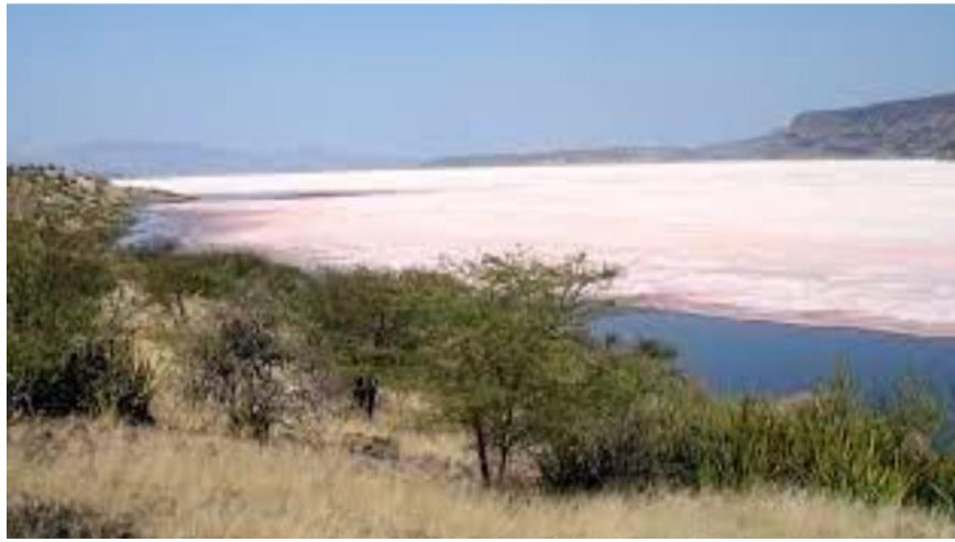
Figure 5 : le Lac Magadi au Kenya.

Les alcalophiles sont souvent isolés de milieux naturels qui ont également tendance à avoir des concentrations élevées en chlorure de sodium (NaCl) ; ceux-ci sont ainsi appelés haloalcalophiles.