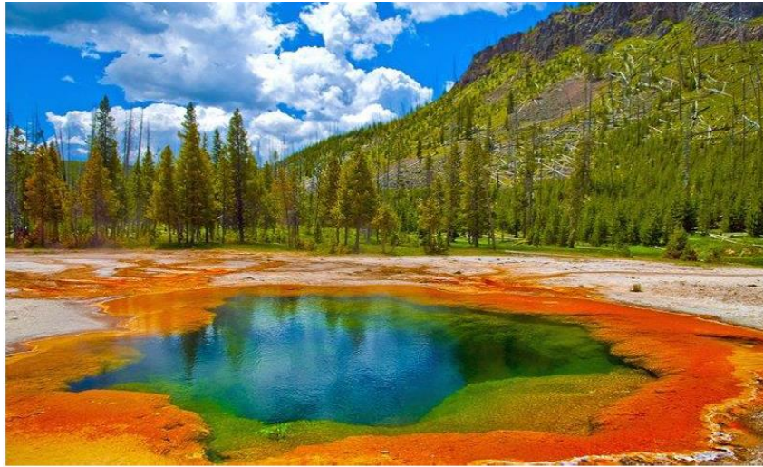
Figure 2 : Sources chaudes dans le Parc national de Yellowstone – USA.

On retrouve dans la plupart de ces écosystèmes des gaz comme H_2 , H_2S , CO_2 , ou CH_4 qui pour certains peuvent servir de sources d'énergie ( H_2 en particulier). Les micro-organismes retrouvés dans ces zones appartiennent aux domaines des Bacteria et des Archaea .