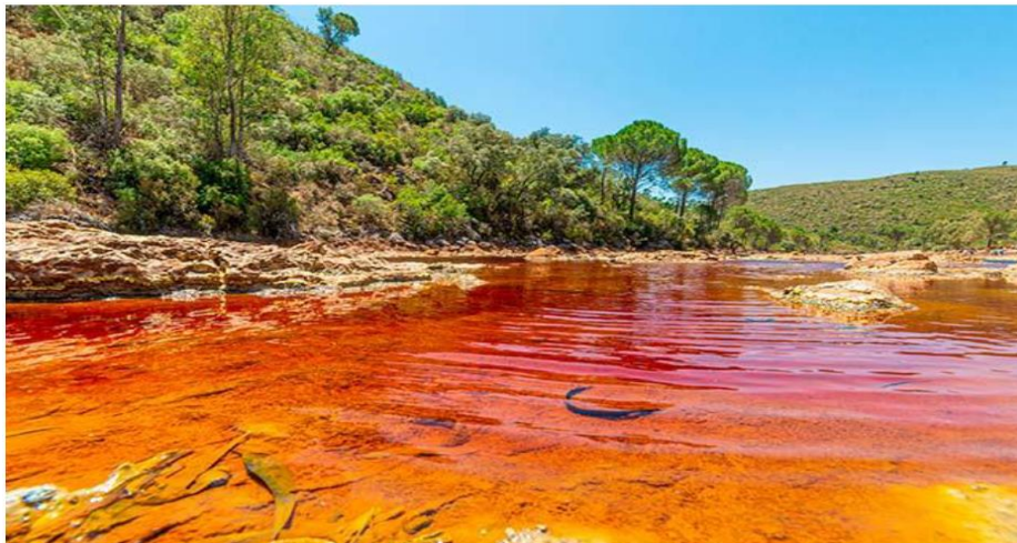
Figure 4 : Le fleuve de Rio Tinto-Espagne.

L'écosystème acide le plus étudié est le Río Tinto en Espagne avec un pH inférieur à 2, une longueur de 100 km de long, une concentration importante en métaux lourds et un surprenant niveau de diversité microbienne ( Fig. 4 ).